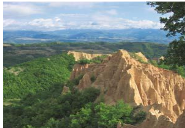
Sandsteinpyramiden in Melnik

Kombinieren Sie eine Flussfahrt mit der «MS Excellence Royal mit einer Rundreise im Königsklasse-Luxusbus! Auf diese einzigartige Art und Weise erleben Sie eine malerische Donau-Flussfahrt durch sieben Länder. Nebst dem Naturparadies Donaudelta entdecken wir – je nach Reisevariante – einige der schönsten Städteperlen und Landschaften Osteuropas. Zum ersten Mal befahren wir zudem die Schwarzmeerküste Rumäniens und entdecken in Bulgarien die Heimat von sieben Unesco-Weltkulturstätten.